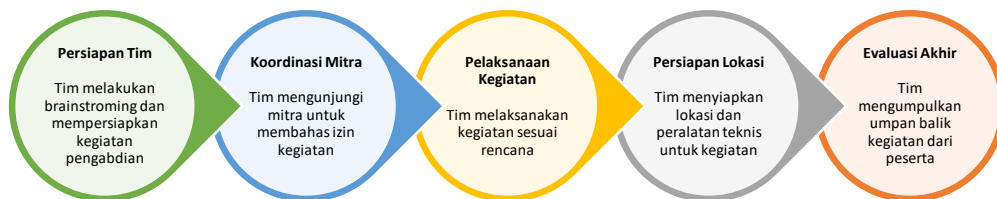
Gambar 1. Tahapan Program Pengabdian Masyarakat

respon dan tingkat kepuasan mitra pengabdian. Adapun metode yang dilakukan dalam kegiatan pengabdian ini dirangkum dalam bagan alir berikut ini: