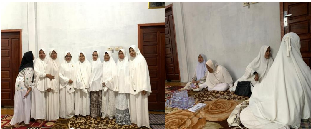
Gambar 3. Suasana Kegiatan Pengabdian Berlangsung

Terakhir, setelah penyampaian materi dan pelatihan penggunaan secara umum selesai dilakukan maka sampailah pada sesi tanya jawab. Beberapa ibu-ibu terlihat antusias bertanya. Setelah sesi tanya jawab selesai, maka kegiatan pengabdian ini juga ditutup dengan pengisiap kuisisioner untuk melihat respon dan umpan balik dari peserta pengabdian. Kesimpulan telah didapatkan dan menunjukkan bahwa ibu-ibu Jemaah Majelis Taklim Ihram Riau merasa puas dengan materi yang disampaikan. Kegiatan pengabdian ini ditutup dengan sesi foto bersama.