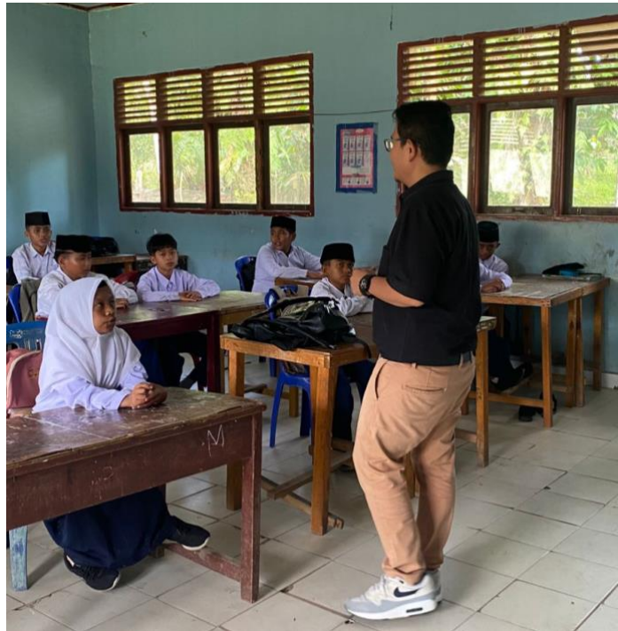
Gambar 2. Pelaksanaan Kegiatan Pengabdian Kepada Masyarakat